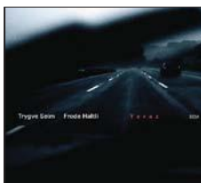
Trygve Seim og Frode Haltli: «Yeraz» ECM (Musikkoperatørene)

I desember 2006 hadde Paul Motian spelejobb på Village Vanguard med ein trio han utvida til Paul Motian Trio + Two. Av det vart det musikk nok til tre album, det første for eit år sidan (Dagsavisen 31. August 2007). Gleda blir ikkje mindre no av å høyre mannen som då var 76 år, med Motian, Chris Potter (tenorsaksofon) og Larry Grenadier (bass), stadig utvida med Greg Osby (altsaksofon) og japanske Masabumi Kikuchi på piano, med fiolinist Mat Manieri som ein liten bonus. Motian gitt ut 24 sterke album med fleire band på merket