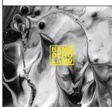
Bank of No Land: «Bank Of No Land» Acoustic Records (Musikkoperatørene)

Winter & Winter, og det er stadig ein svir å høyre ein Motian som i sitt frie trommespel faktisk minner om vår eigen Jon Christensen. Motian har skrivne det meste sjølv, unntatt ein versjon av «If You Could See Me Now» der fela til Manieri erstattar saksofonen til Osby, pluss «Till We Will Meet Again», med groovy saksofonopning av Potter og Osby. Stemninga er høg i Village-kjellaren.